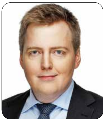
Sigmundur Davíð Gunnlaugsson forsætisráðherra

Íslendingar setja norrænt samstarf í öndvegi og taka að sér formennsku í Norrænu ráðherranefndinni með stolti og eftirvæntingu.