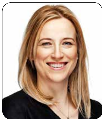
Eygló Harðardóttir samstarfsráðherra Norðurlanda